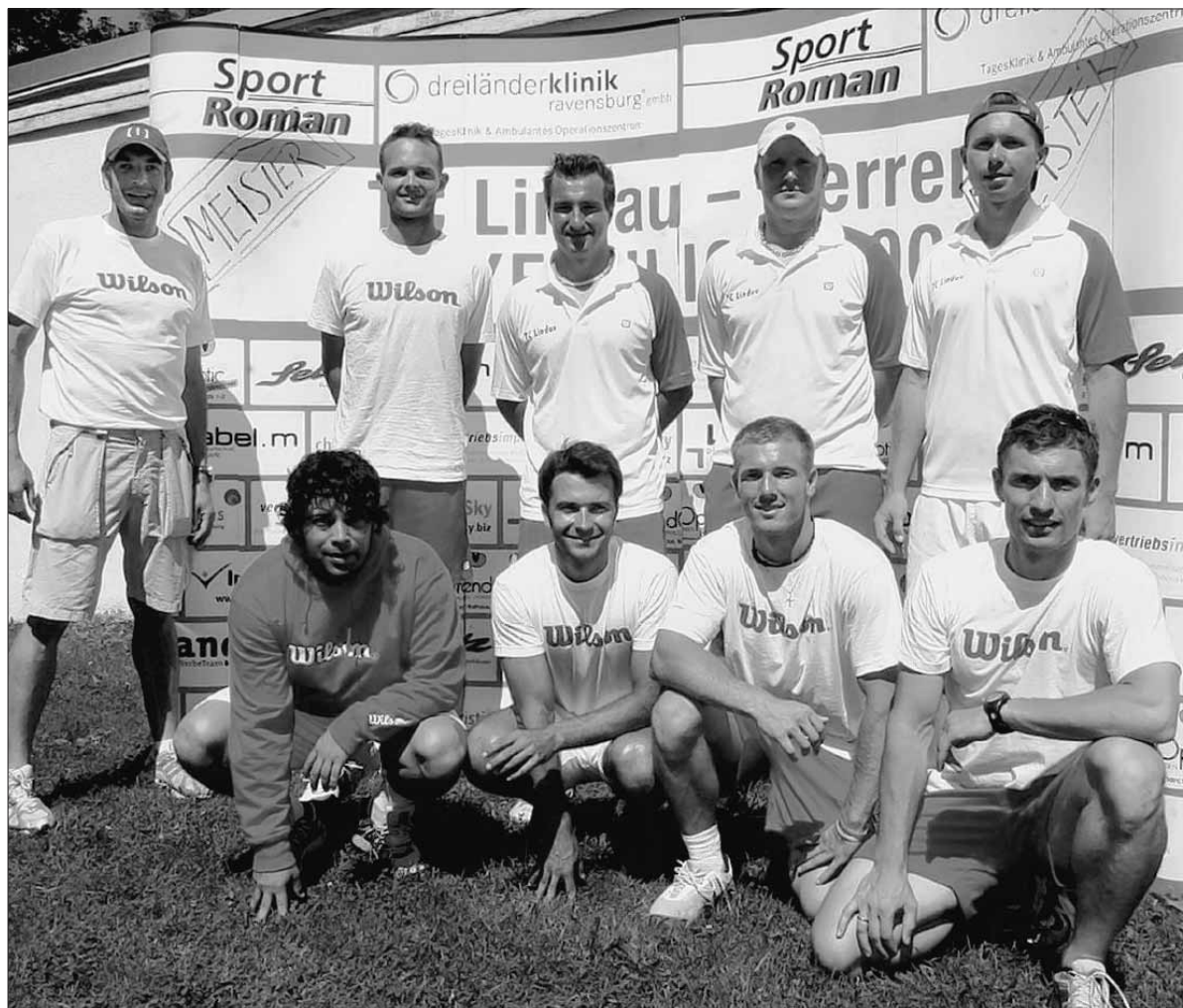
Unglaublich aber wahr: Die Tennismannschaft des TC Lindau ist weiterhin ungeschlagen und steht bereits als Meister der Bayernliga fest.